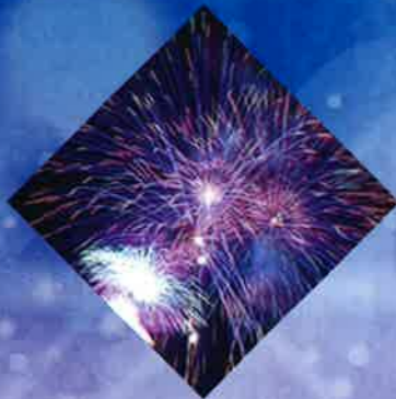
三色グラデーション花火