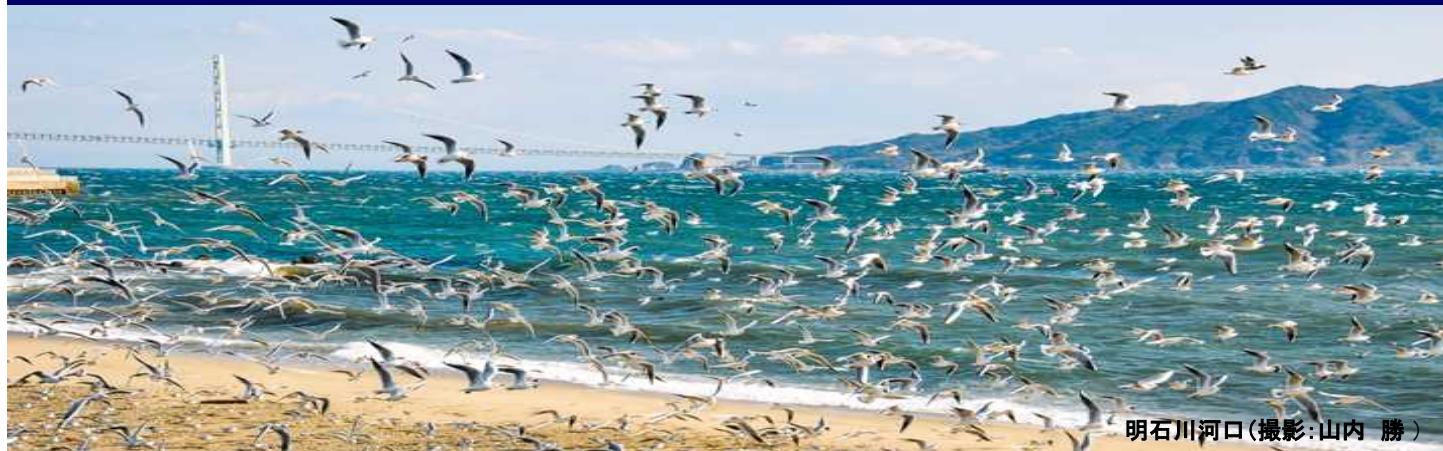
明石川河口

海への理解を深め、豊かで美しい海を未来へ引き継いでいくために、 海でさまざまな取組をしている団体の活動事例を紹介します。