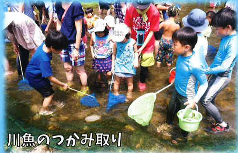
川魚のつかみ取り

二連原区では、自然と触れ合えるわくわく里山体験を年間通じて実施中！楽しく素敵な体験をお届けします♪ぜひ、ご参加ください！