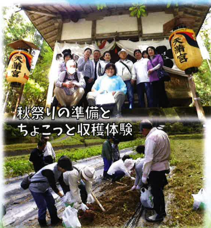
秋祭りの準備と ちよこつと収穫体験