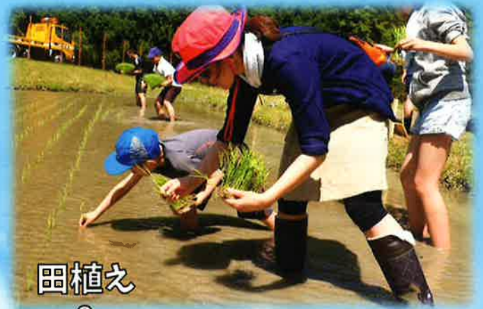
田植え & 稲刈り