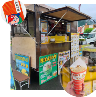
出店名：チョコバナナ クレープ・いちご大福 コーヒーなど