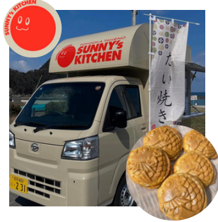
出店名：SUNNY's KITCHEN たい焼きなど