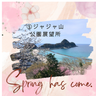
⑤ ジャジャ山 公園展望所