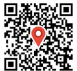
JR竹野駅 竹野町竹野字東町 196-4