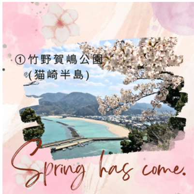
① 竹野賀嶋公園 (猫崎半島)

当日はJR竹野駅の桜の木ライトアップをいたします。また竹野地域のお花見スポットを特集してみました。列車やレンタサイクルを使って各所見どころを巡ってみよう🌸