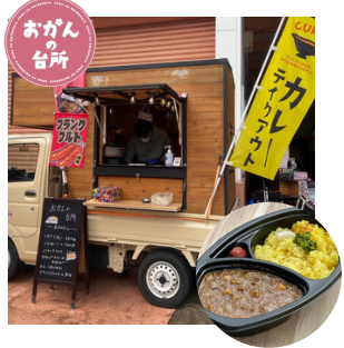
出店名：おかんの台所 カレー フランクなど