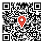
おまき桜 竹野町椒 檮椒(ほそき)神社