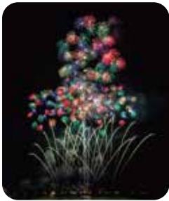
Welcome to TAKENO!!