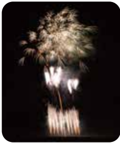
白に散るきらめき