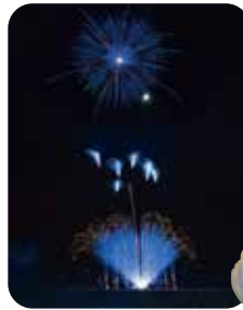
藍流星群～あいらゆうせいぐん～ たけのシンフォニー