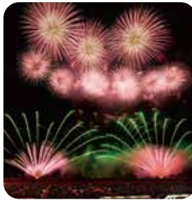
ルビーの花 エメラルドの息吹